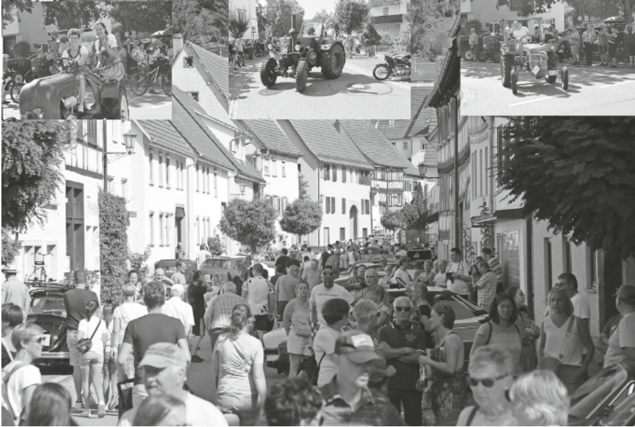
Das beigefügte Lichtbild zeigt Eindrücke vom Oldtimertreffen.

Das Oldtimertreffen in Fridingen findet nun schon ein viertel Jahrhundert statt. Dieses Jahr, im Jahr 2023, war ein Jubiläum fällig: „ 25 Jahre Oldtimertreffen in Fridingen “. Der gute Besuch der gelungenen Veranstaltungen ist für die Organisatoren und die Stadtverwaltung Ansporn, den Besuchermagnet auch im Jahr 2024 wieder fest in das Stadtfestprogramm zu integrieren.