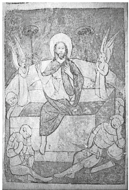
Auferstehung Christi, Fresko in St. Gallus, Mühlheim an der Donau, 15. Jh.