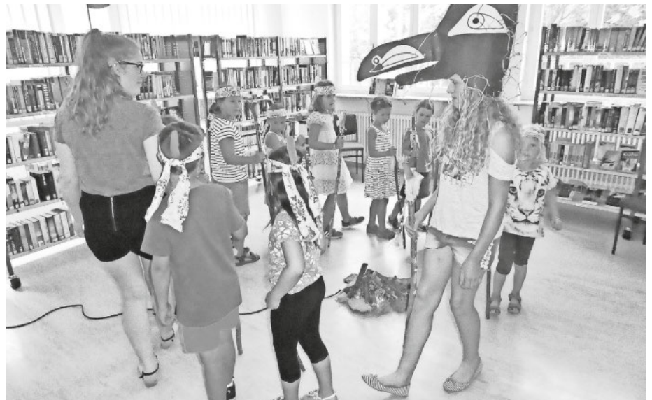
(Die begeisterten Kinder beim Stocktanz um das Lagerfeuer)

Wie immer in der Ferienzeit, bot auch dieses Jahr wieder unsere Mediathek (bestehend aus der Kath. Öffentl. Bücherei und der Stadtbücherei Fridingen) einen kreativen Nachmittag für Kinder von 5-9 Jahre an. Thema war diesmal: Ein Tag bei den Indianern. Zunächst wurde das Buch mit gleichem Titel als Bilderbuchkino vorgelesen. Dabei wurde ausführlich erklärt wie die Indianer mit Ihren besonderen Zelten, Tipi genannt, den Sommer über in der weiten Prärie leben, sich schmücken, musizieren, tanzen und jagen.