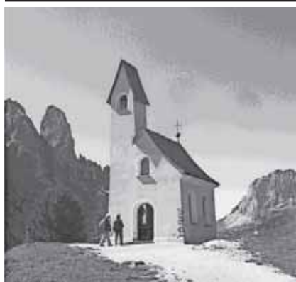
Die Stille ist nicht auf den Gipfeln der Berge, der Lärm nicht auf den Märkten der Städte; beides ist in den Herzen der Menschen. aus Indien