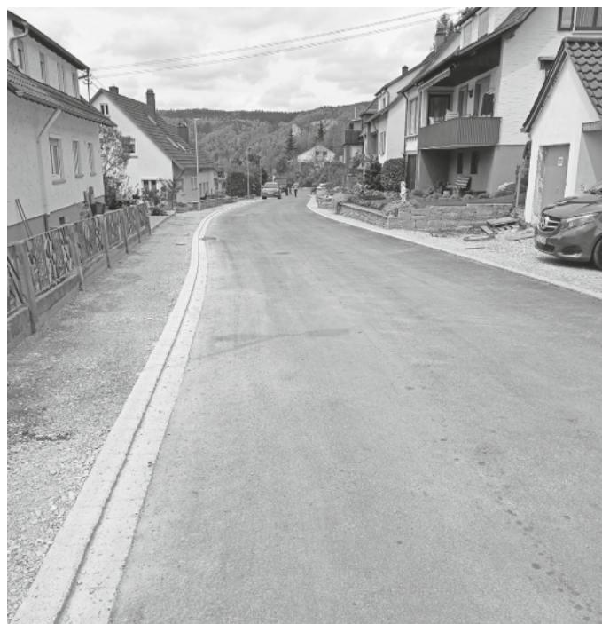
Bereits sanierte Straßenzüge

Aufgrund der topographischen Gegebenheiten und einer Einbahnstraßenregelung handelte es sich bisher bei der Abwicklung dieses Sanierungsgebiets in der Tat um eine sehr anspruchsvolle und fordernde bauliche Maßnahme, welche den bauausführenden Firmen und Anwohnern einiges abverlangte. Die Verwaltung dankt diesen für das aufgebrachte Verständnis, mussten diese doch immer wieder mit beträchtlichen Einschränkungen leben. Ein Dankeschön gilt auch dem Land für die Zuschussmittel aus dem städtebaulichen Förderprogramm.